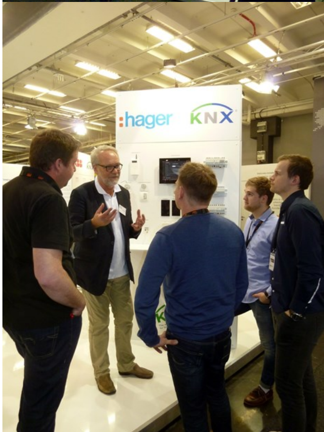
Några bilder från vår välbesökta monter.